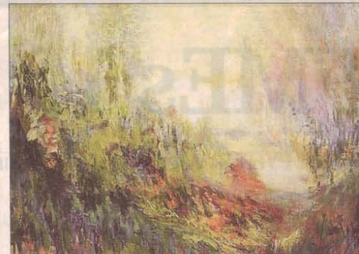
"MY BEAUTIFUL garden"